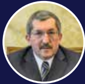
Yönetim Kurulu Üyesi Rafet Vergili Karabük Belediye Başkanı