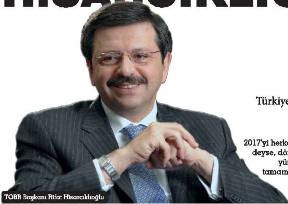
TOBB Başkanı Rifat Hisarcıklıoğlu

Türkiye Odalar ve Borsalar Birliği Başkanı Rifat Hisarcıklıoğlu ile 2017 yılını ele alan ve 2018 yılı beklentileri üzerine bir SORU-CEVAP gerçekleştirdik.