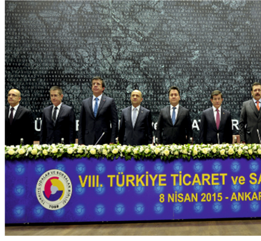
VIII. TİCARET ŞURASI GERÇEKLEŞTİ