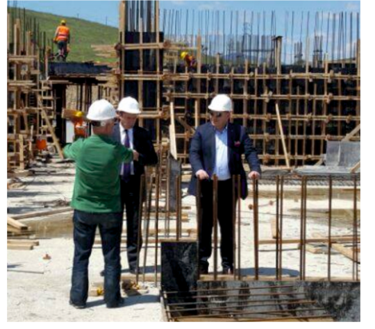
TOBB ENDÜSTRİ MESLEK LİSESİ