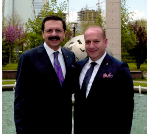
TOBB 71. GENEL KURUL YAPILDI