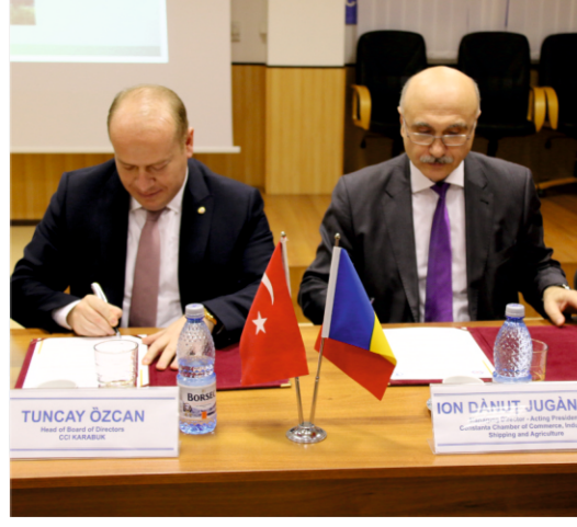
KARABÜK TSO ROMANYA'DA