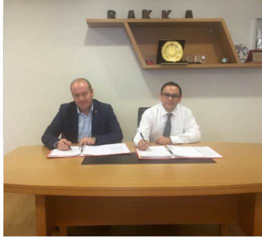
ÜRETEEN ELLER PROJESİ BAŞLADI