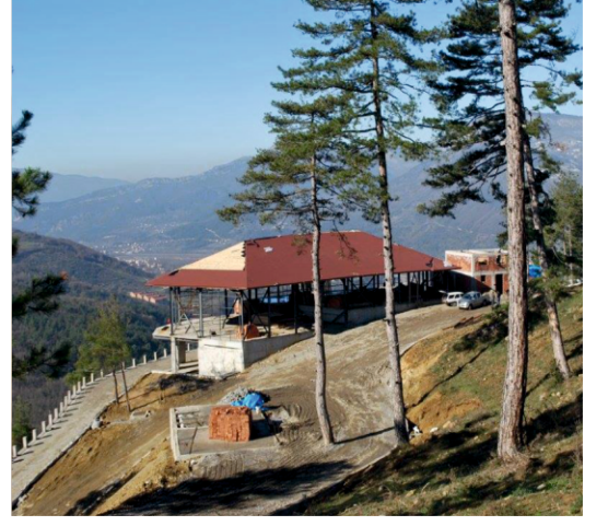
YENİCE SEYİR TERASI YÜKSELİYOR