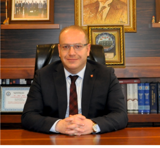
İSMETPAŞA EN ÖNEMLİ PROJEMİZDİR