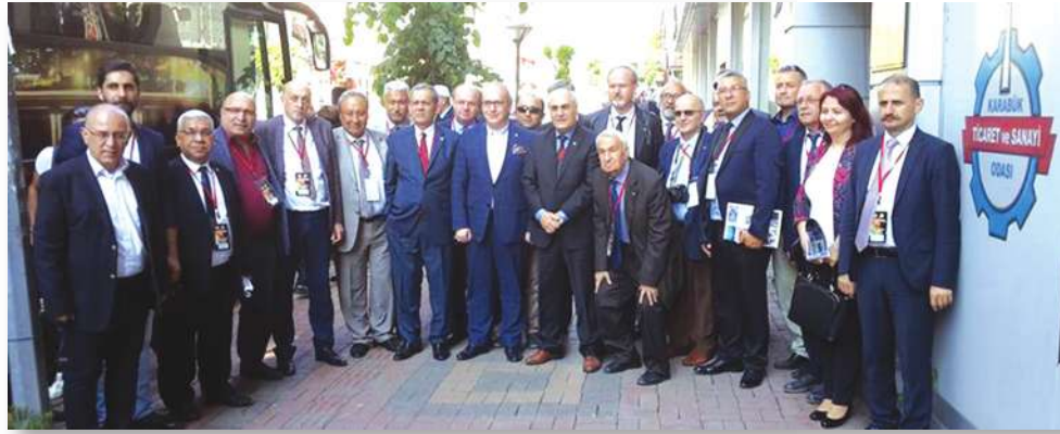
İlimizi ziyaret eden Gazeteciler Cemiyeti Başkanlarının odamızı ziyaretleri