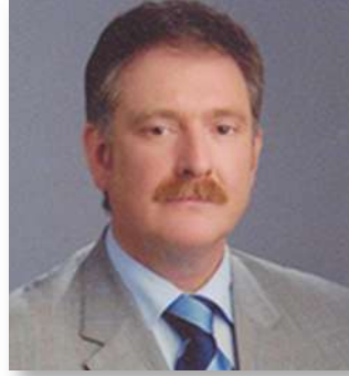
Timurçin SAYLAR Meclis Başkanı