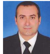
Sezgin Dıravacı Meclis Üyesi