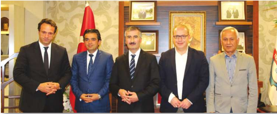
KOSGEB Başkanı Sayın Recep BİÇER'in odamızı ziyaretleri