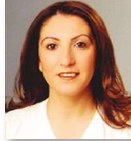
Pelin Er Oda Sicil Mdr Yrd. Akreditasyon