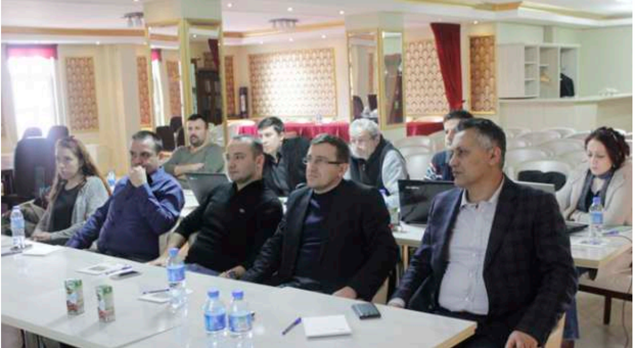
31.01.2015 Odamız ve Safranbolu TSO işbirliği ile Ticaret Sicili Müdürlüklerince uygulanan MERSİS Eğitimi düzenlenmiştir.