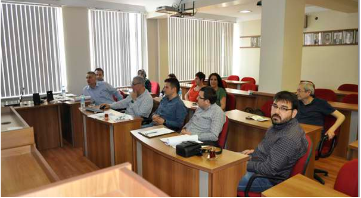
09.05.2015 11.dönem akreditasyon çalışmaları kapsamında akreditasyon gözden geçirme istişare toplantısı yapılmıştır.