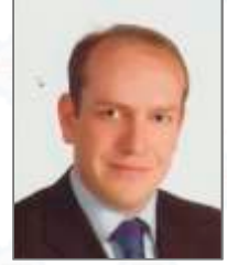
Tuncay ÖZCAN Meclis Üyesi