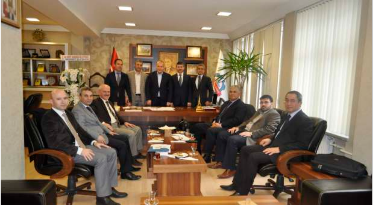
11.05.2015 Oda Kamu İşbirliği kapsamında İl Müdürleri ile toplantı düzenlenmiştir.