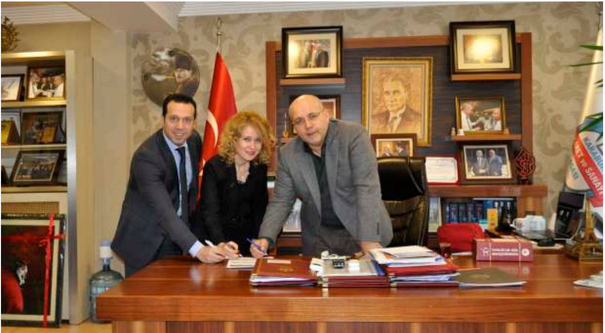
16.01.2015 Odamız ve İş Bankası Anadolu Emeklilik protokolü imzalanmıştır.