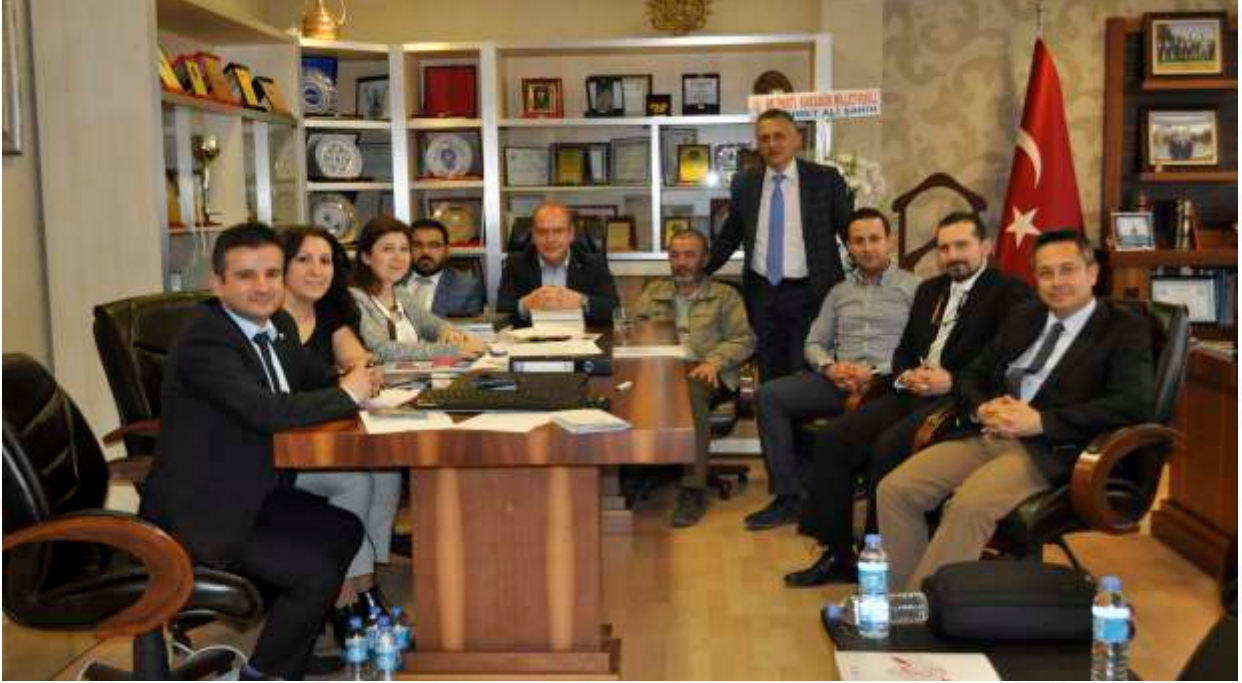
14.05.2015 11.Dönem akreditasyon çalışmaları kapsamında Türk Loydu denetçileri odamızı ziyarette bulunmuştur.