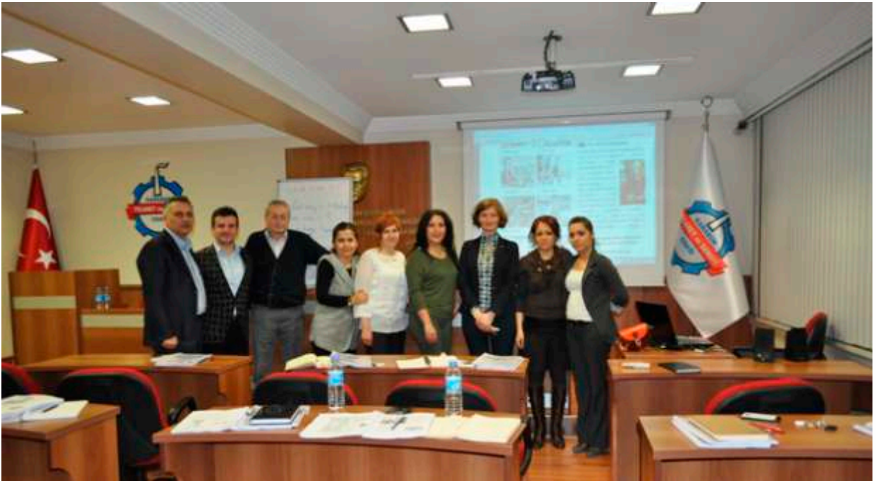
01.04.2015 Odamız çalışanlarına yönelik yabancı dil(İngilizce)eğitimleri başlamıştır.