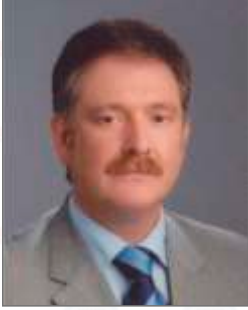
Timurçin SAYLAR Meclis Başkanı