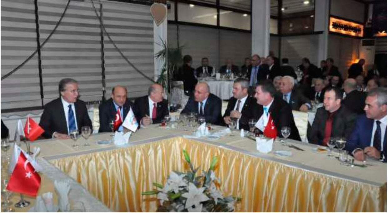
10.01.2015 Ekipazar Metal ve Metal Ürünleri İhtisas OSB toplantısı Bilim, Sanayi ve Teknoloji Bakanı Fikri Işık,Ulaştırma,Denizcilik ve Haberleşme Bakanı Lütfi Elvan,Milletvekilllerimiz ve üyelerimize yapılan davetle sunulmuştur.