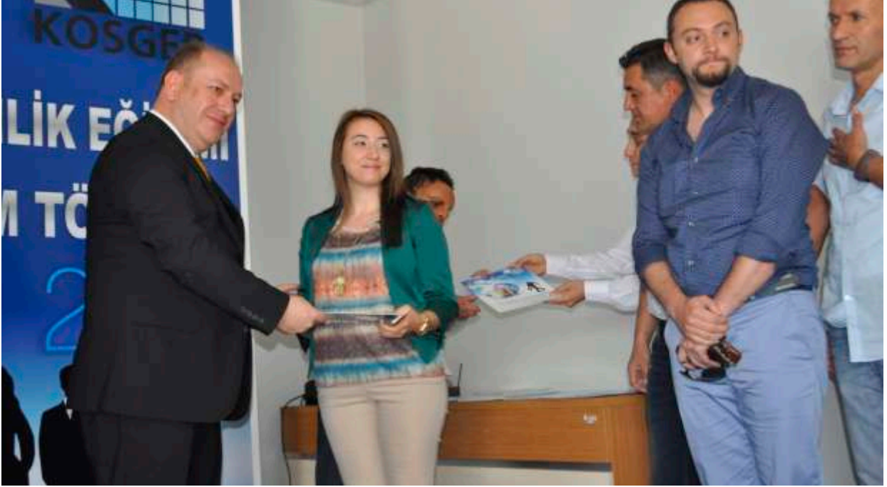
30.06.2015 Odamız, İş-Kur ve KOSGEB işbirliğiyle tamamlanan Uygulamalı Girişimcilik kursu kapsamında 72 Kursiyer için sertifika töreni düzenlenmiştir.