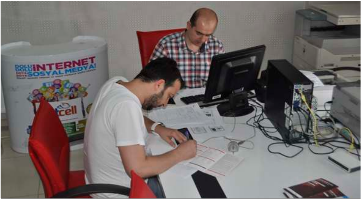
02.07.2015 Odamız ve PTT işbirliğinde kayıtlı Elektronik Posta (KEP) ve Elektronik İmza (E-İmza) uygulamasından üyelerimiz faydalanmıştır.