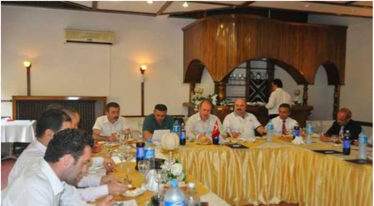
18.06.2015 Oda Kamu İşbirliği toplantısı gerçekleştirilmiştir.