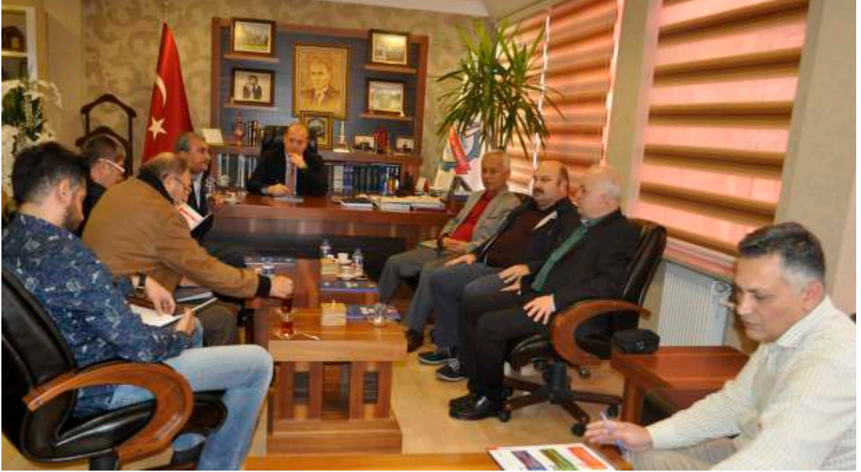
14.10.2015 Meslek Komiteleri Takip komisyonunun meslek komitelerimizin etkin çalıştırılması konulu toplantısı gerçekleşmiştir.